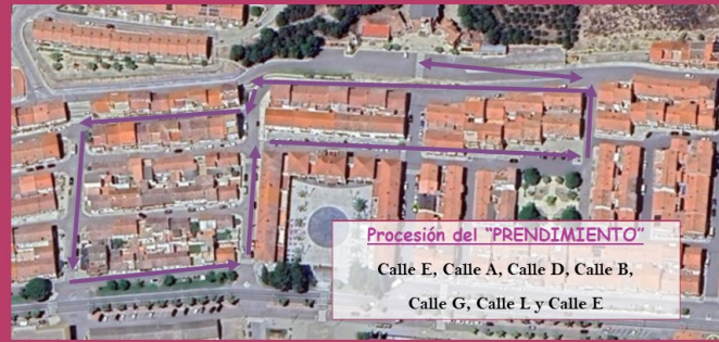
Procesión del "PRENDIMIENTO"

Calle E, Calle A, Calle D, Calle B, Calle G, Calle L y Calle E