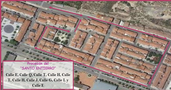
Procesión del "SANTO ENTIERRO"

Calle E, Calle A, Calle D, Calle B, Calle G, Calle L y Calle E