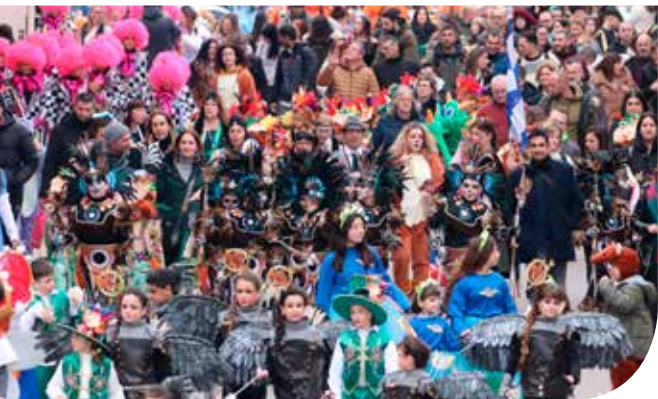
Primer premio Infantil 2025