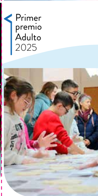
Primer premio Adulto 2025