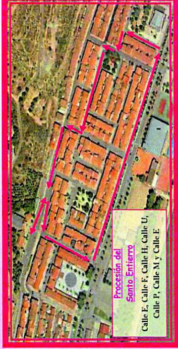
Procesión del Santo Entierro Calle E, Calle F, Calle H, Calle U, Calle P, Calle M y Calle E.