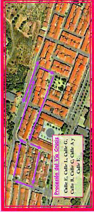
Procesión del Vía Crucis Calle E, Calle L, Calle G, Calle B, Calle C, Calle A y Calle E.